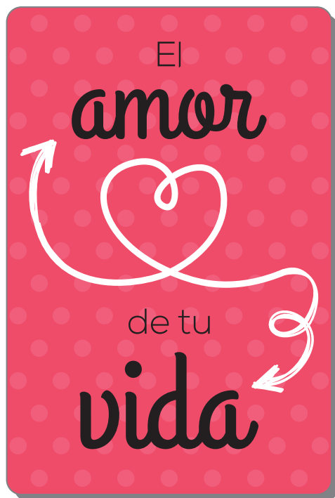
Tarjetas SAN VALENTÍN