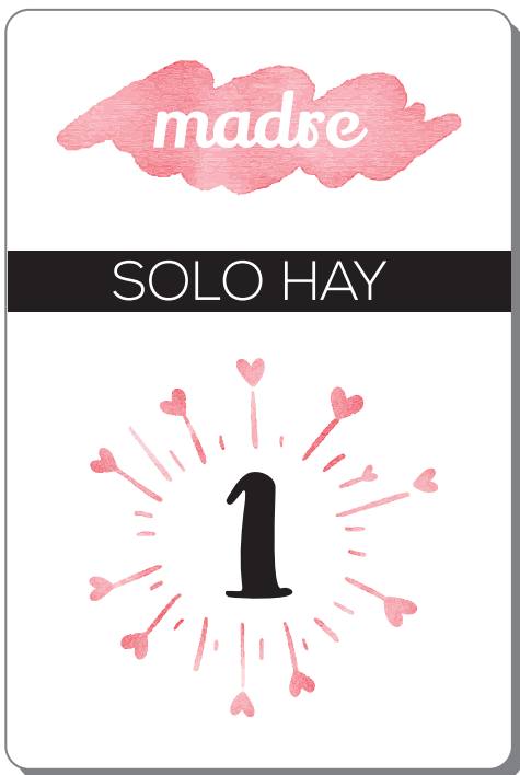
Tarjetas DÍA DE LA MADRE